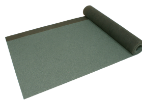
強力ガムフェースEX