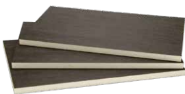
写真はギルフォーム35S

外断熱用の硬質ウレタンフォーム。熱伝導率が極めて低い炭化水素系発泡ガスを内包した、完全ノンフロンタイプの断熱材。SとWの2サイズがある。