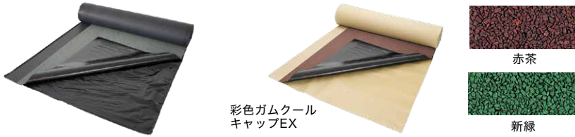
彩色ガムクールキャップEX