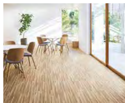
2 ビニル床シート PERMALEUM・ACFLOOR, etc

熱溶接工法により、シームレスな床仕上げが可能。そのうえ、継目がないノーワックスメンテナンス対応のためメンテナンスしやすいのが特長です。汚れ防止や衝撃吸収などの機能を付加した製品もあり、文教施設から医療・福祉施設まで幅広くお使いいただけます。