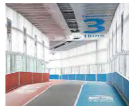
4 天井 CEILING

いまだデザイン表現の場として、あまり使用されていない天井。ORIFYは、建物の内外、床・壁・屋上で培った技術を用いて、機能的なサインや、グラフィック表現を天井で展開し、新たな可能性を模索しています。