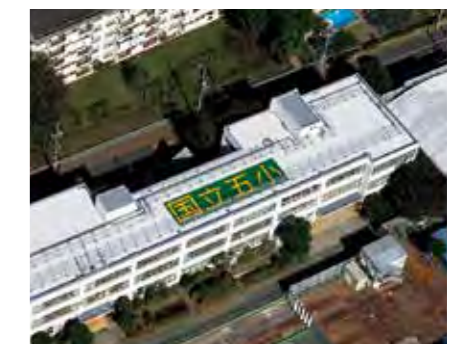
H ヘリサイン FLECTOR FILM

緊急時に空から救援物資や救助を行う災害対策用ヘリコプター。目印とするのが、屋上に描かれたヘリサイン。いつ起こるか分からない災害に備え、明確な視認性が重要です。「フレクターフィルム」は、夜間でも安心な再帰性反射性能を持ち、24時間確かな視認性を保ちます。