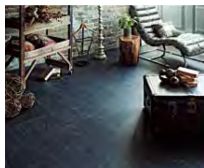
1 ビニル床タイル Ptile・MATIL・WOODLINE, etc

我が国初のビニル床タイルとして「Pタイル」を1953年に発売。それ以来、塩ビ樹脂の加工性を活かして、様々な仕様やデザイン、サイズのビニル床タイルを開発し、公共施設から店舗まで多岐にわたり使用されています。