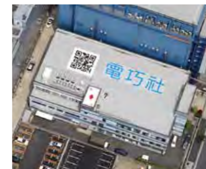
5 屋上 ROOFTOP

誰にも見られない空間…だったはずの屋上は、今やWEBを通じて多くの人々が見ることが出来るオープンな空間へ。防水事業での知見を活かしたORIFYが、屋上グラフィックの可能性を切り拓き、新しい市場を開拓しています。