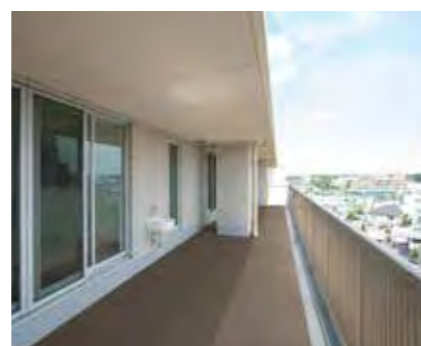
3 耐候・防滑性ビニル床シート VIEWGISTA

開放廊下やバルコニーは、集合住宅にとって欠かせない大切な空間です。雨や陽射しにさらされるなか、防滑性能を長期にわたり維持することが求められます。ビュージスタは優れた耐候性、防滑性で安全を確保、バリエーション豊かなデザインを取り揃えています。