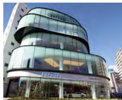
3 ガラス GLASS

光を透過したり、反射したりと、多彩な姿で人々を魅了するガラス。ORIFYはガラスが使用されるあらゆるシーンに寄り添い、多彩なデザインと斬新なアイデアで透明なガラスに意匠性と機能性を生み出します。