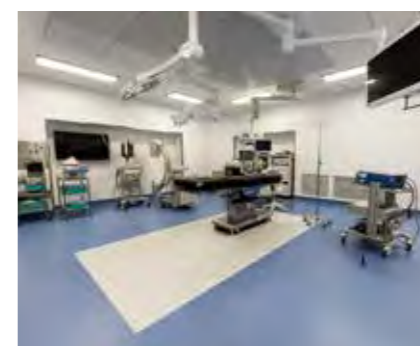
5 特殊機能床 FUNCTION FLOORING

病院や研究室、工場などの施設では、薬品や静電気への対策、滑りにくさや耐久性など様々な機能が求められます。機能床シリーズは各施設で床材に求められる特殊機能に特化した製品を各種取り揃えています。