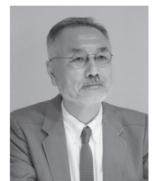
株式会社 Arch5 取締役