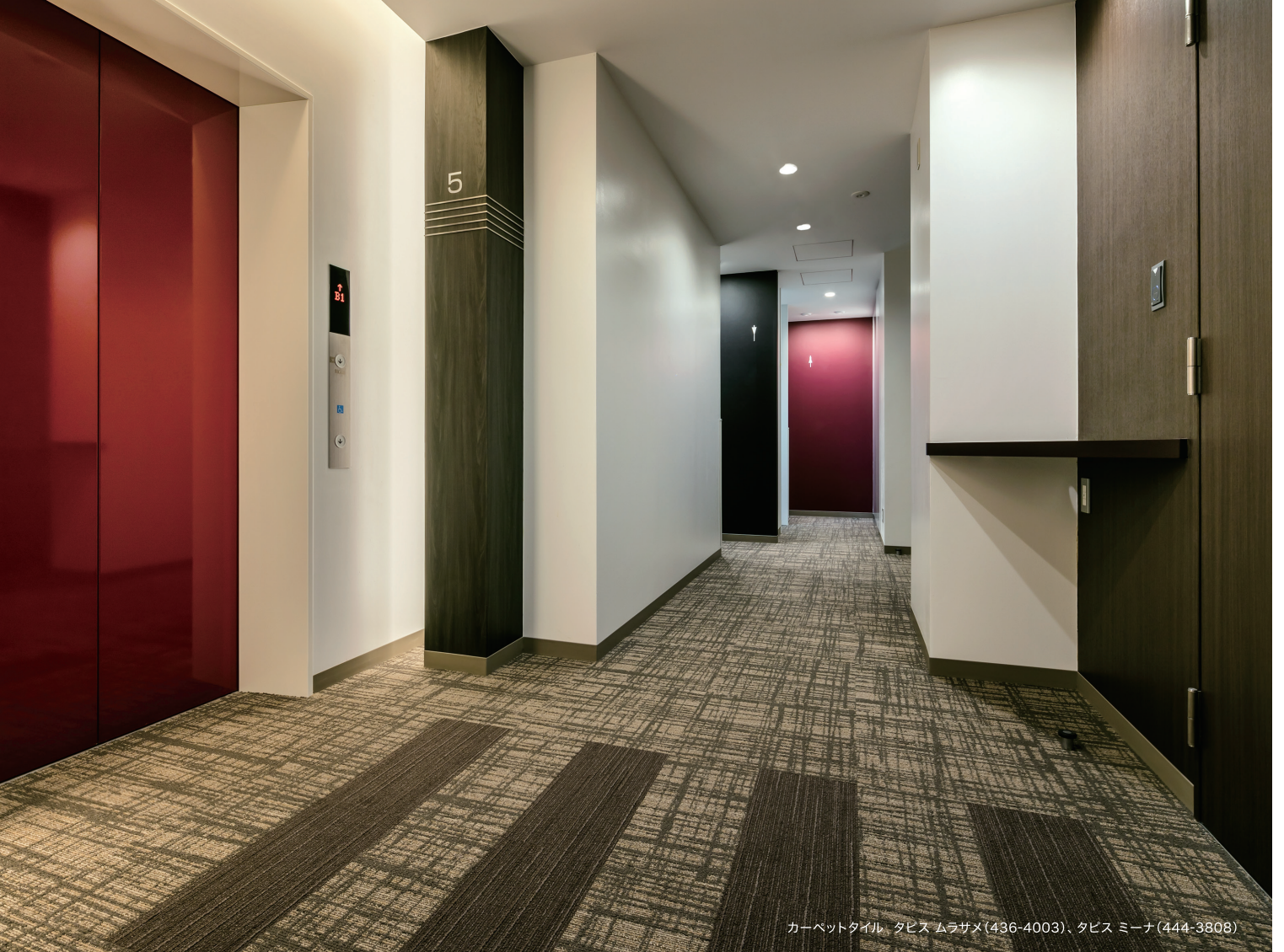
カーペットタイル、タビス ムラサメ(436-4003)、タビス ミーナ(444-3808)