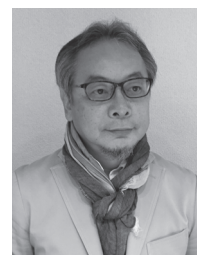
株式会社 Arch5 代表取締役