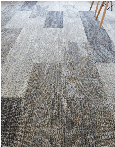
カーペットタイルの柄が木漏れ日に。

無機質な空間になりがちなスモールオフィスを、樹木と木漏れ日でオーガニックにまとめたコムロック。ケーブルの接続がネットワークを構築していくように、社員の和もオフィスで育まれることでしょう。