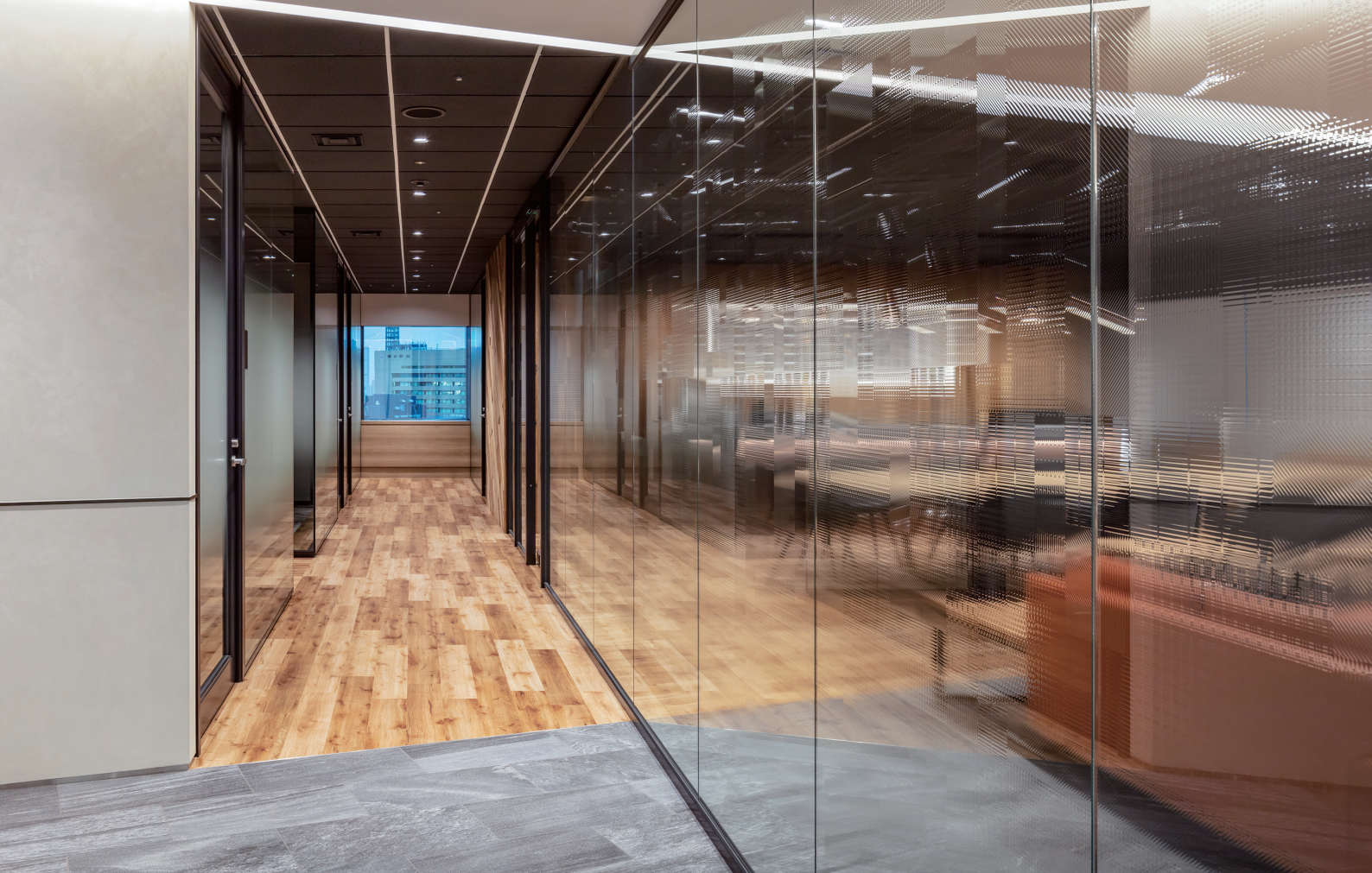
超高層ビル内でありながら、働く人々のために開放感を感じさせる工夫が随所に施された廊下。ガラスフィルム(オリフィクリアクロス)、置敷きビニル床タイル(レイフラットタイル LF-3000 LF-3520/3521)