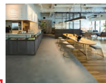
レイフラットタイルノーワックス LN-1008,1009,1535

より高いメンテナンス性と防汚性を求めるなら レイフラットタイルノーワックス ノーワックスメンテナンス仕様で、抗菌性も付いたハイグレードライン