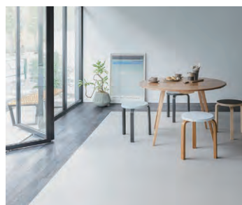
モルタライク 647-702, デニムフロアFT DMH-201